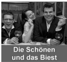
Die Schönen und das Biest

Infos: Tourist-Info Zell am Harmersbach, Alte Kanzlei, Tel 07835/6369-47, tourist-info@zell.de, www.zell.de