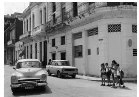
Oldtimer in Havanna.

Kuba steht ein großer Wandel bevor. Viele Touristen wollen die sozialistische Insel mit ihren tropischen Stränden, amerikanischen Oldtimern auf den Straßen Havannas und Musik an jeder Ecke noch sehen, bevor sie sich wohl für immer verändert. Ulrich Spitzmüller stellt Kuba in einer Bilderschau der Volkshochschule Kinzigtal am Donnerstag, 17. März um 20 Uhr im Kultur- und Vereinszentrum „Obere Fabrik“ in Zell am Harmersbach vor. Havanna strahlt trotz seiner bröckelnden Fassaden immer noch viel Charme aus. In der Altstadt wird kräftig renoviert. Noch immer zehrt Kuba von seinem Erbe - von den Revolutionshelden Che Guevara und Fidel Castro oder von alten Kolonialstädten mit bunten Häusern. Die vielen jungen Menschen lieben „ihr“ altes Kuba, sind aber längst auf dem Weg in eine bessere Zukunft unterwegs.