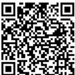
QR-Code Meldeplattform Asiatische Hornisse

Um möglichst rasch Maßnahmen zum Fang der Königinnen und Beseitigung der Nester der Asiatischen Hornisse zu veranlassen, bittet das Ministerium für Umwelt, Klima und Energiewirtschaft um Meldung von Sichtungen in Baden-Württemberg. Dies ist über die Meldeplattform auf der Homepage der Landesanstalt für Umwelt (LUBW), aber auch über die kostenlose „Meine Umwelt-App“ möglich: